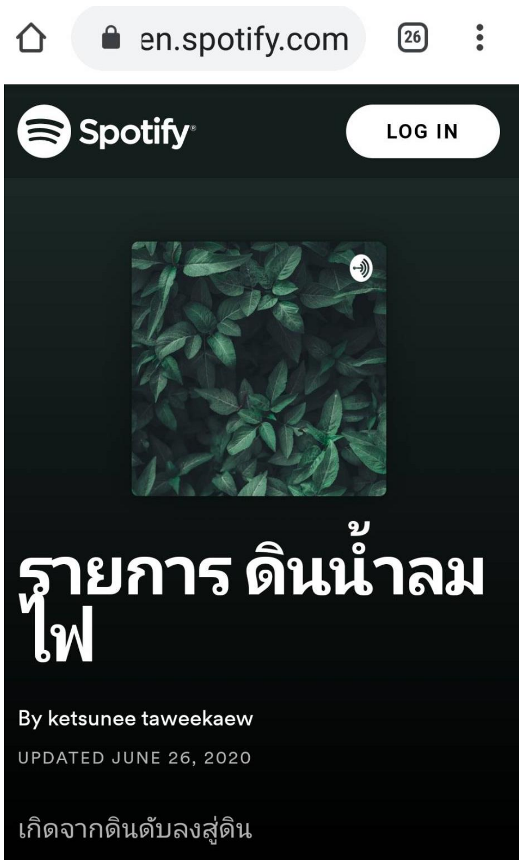
ภาพ 2 ตัวอย่างช่องสถานี